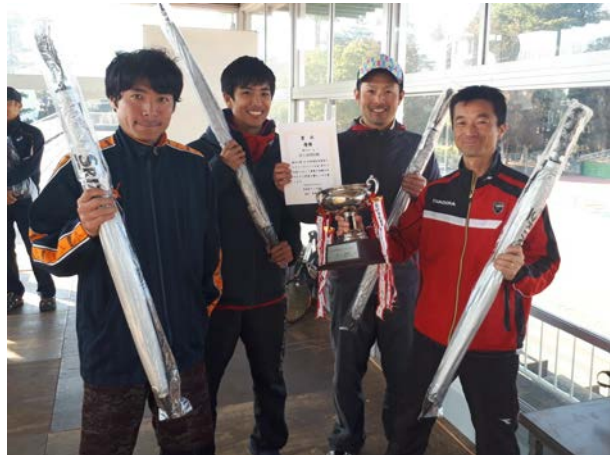
男子準優勝：日製日立会